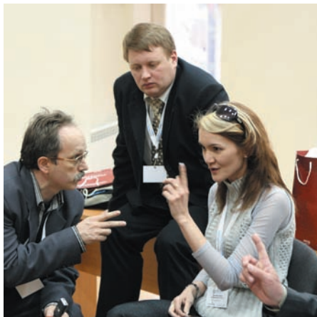
Сама атмосфера семинара была свободна от формальностей и подчинена духу сотрудничества

С 15 по 17 апреля Ассоциация «Уралтелесеть» и компания «Лардо Телеком» в одиннадцатый раз провели семинар операторов кабельного ТВ и мультисервисных сетей Multiservice 2010. В этом году на базе отдыха под Екатеринбургом собралось более 150 участников из 53 городов России, Беларуси, Казахстана и Молдовы.