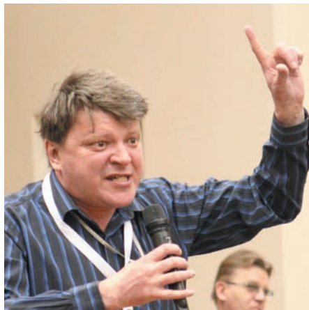
На семинаре не было традиционных реляций об итогах текущего года, зато были жаркие дискуссии